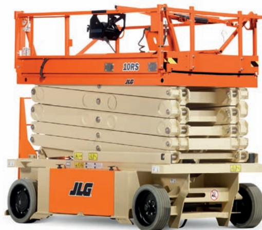
10RS in Transport Konfiguration mit abgeklappten Geländer